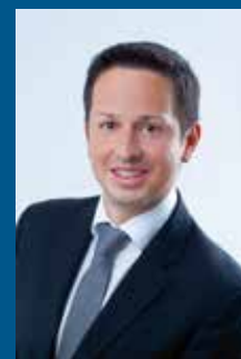
DR. MARIO ART

Buchen Sie Ihren persönlichen Termin unter www.faf.at/booked-calendar oder schreiben Sie uns eine E-Mail an office@faf.at .